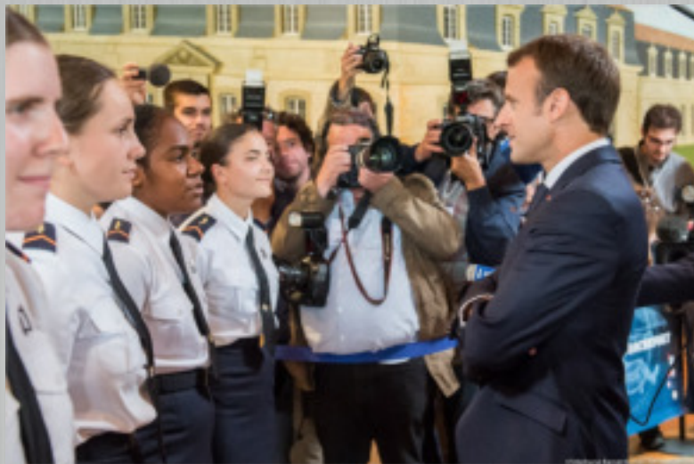
Le Président de la République à la rencontre des élèves techniciens.

L'E.E.T.A.A. 722 est une école d'enseignement technique dépendant du ministère des Armées. Elle forme les futurs techniciens aéronautiques de l'armée de l'air.