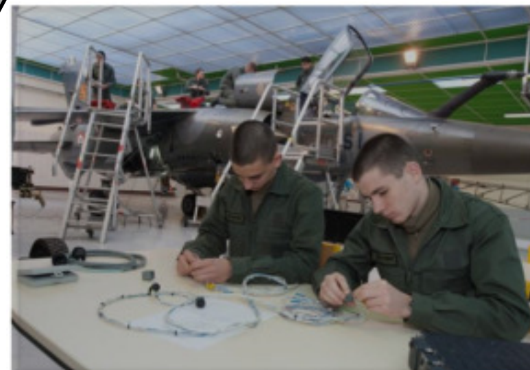
Des élèves préparent du câblage devant le Mirage F1

Le certificat d'aptitude professionnel, CAP, aéronautique option systèmes forme des techniciens intervenant dans le secteur de la maintenance des avions. Ils exerceront leurs activités dans le domaine des systèmes techniques (mécaniques, hydrauliques, etc) et équipements de l'avion.