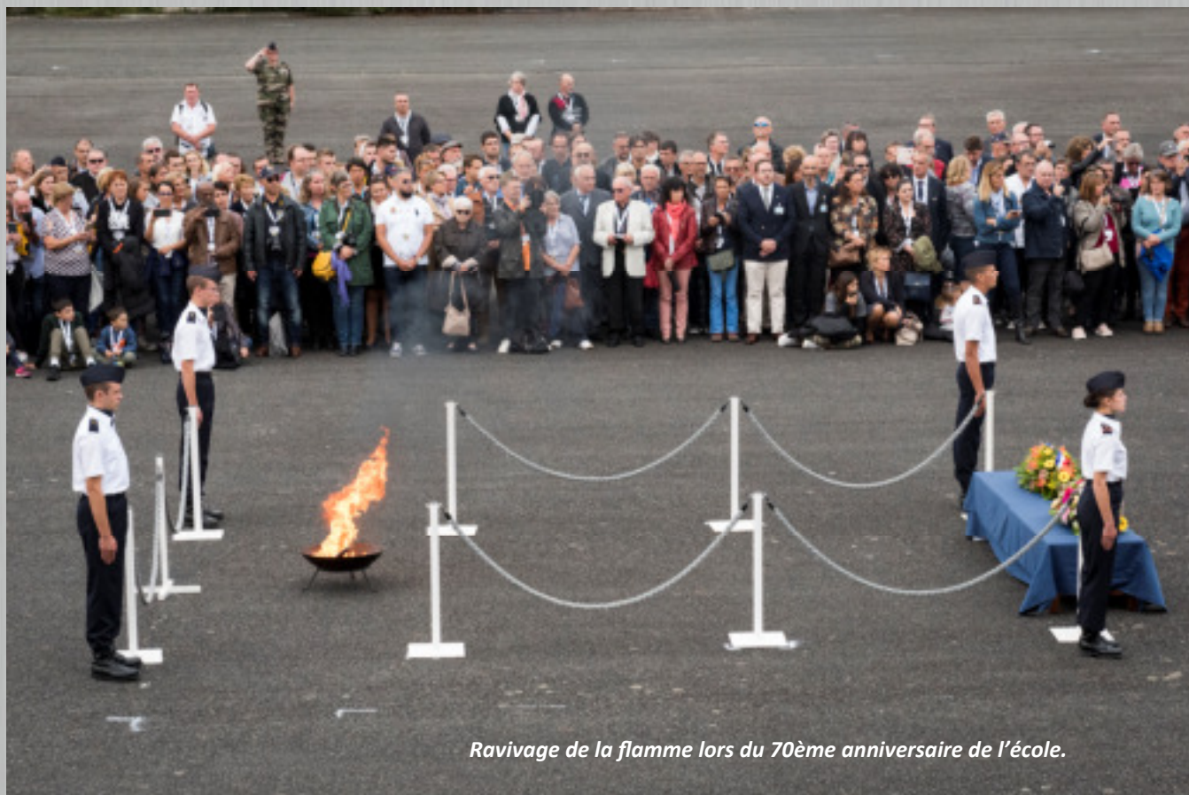
Ravivage de la flamme lors du 70ème anniversaire de l'école.

Les téléphones et les ordinateurs portables sont tolérés, toutefois leur utilisation est soumise à des règles strictes (horaires d'utilisation, autorisation, ...). La possession d'un ordinateur portable est inutile le premier mois, le temps de la formation militaire. Votre enfant pourra l'utiliser pour le travail ou la détente dans les bâtiments hébergement qu'au retour du weekend suivant la présentation au drapeau lorsque les activités scolaires et militaires le permettront.