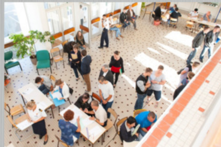
L'atelier administration militaire le jour de l'incorporation.

A l'issue de sa scolarité à l'EETA l'élève titulaire du baccalauréat souscrit obligatoirement un engagement de cinq ans et quatre ans pour un élève titulaire du certificat d'aptitude professionnel, celui-ci prenant effet le jour de la sortie de l'école.