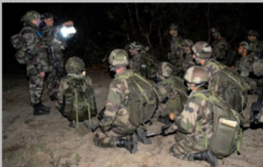
Exercice de combat de nuit

La FMI est sanctionnée par le certificat d'aptitude militaire (CAM) indispensable pour l'admission en école de spécialisation en tant qu'élève sous-officier et la promotion au grade de caporal. Elle est sanctionnée par le certificat militaire élémentaire (CME) pour les élèves préparant le CAP.