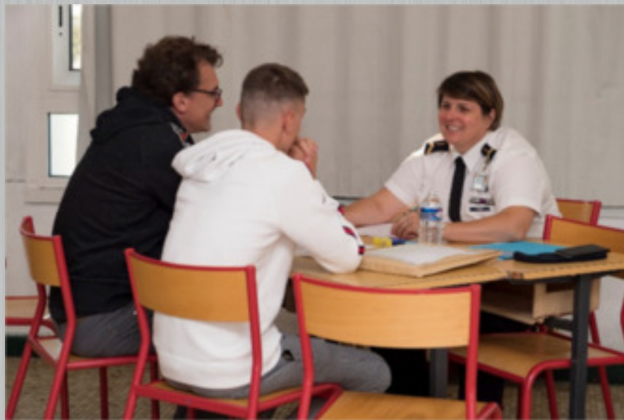
Premier échange avec une éducatrice.

L'incorporation dure toute la journée et, sauf cas de force majeure, la présence du représentant légal est obligatoire. Ce jour-là, vous prendrez contact avec l'encadrement et connaîtrez l'environnement au sein duquel il va désormais évoluer .