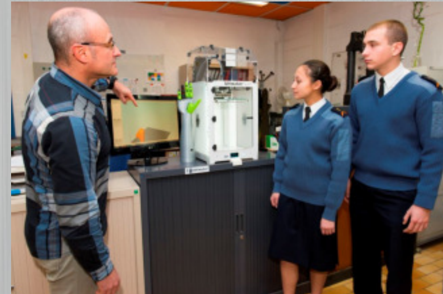
L'imprimante 3D au service des sciences de l'ingénieur

Quel que soit l'examen, l'école est centre d'examens.