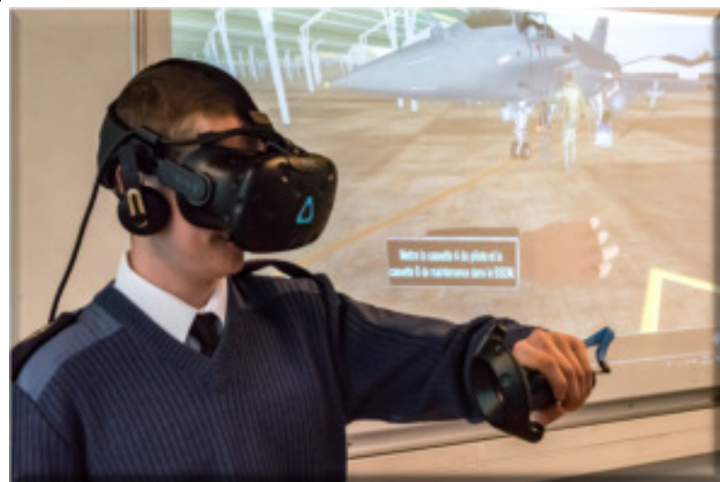
La maintenance virtuelle d'un avion.

Dans le cadre de la réforme du baccalauréat, l'élève subit également les E3C, évaluations communes de contrôle continu dans différentes matières comme les langues vivantes, l'histoire-géographie ou l'EPS.