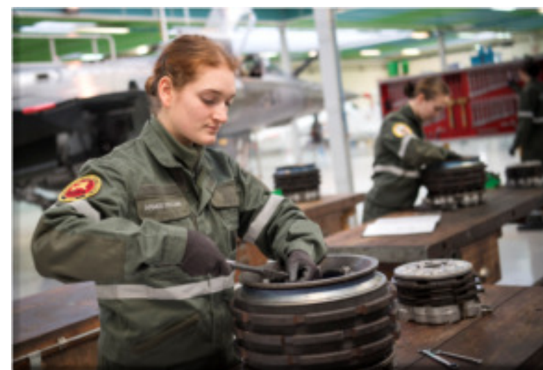
Une élève technicienne dans l'atelier avion.

L'élève est évalué régulièrement au titre du contrôle en cours de formation (CCF) dans la plupart des matières. Les élèves suivant cette filière ont des périodes de formation en milieu professionnel (PFMP). L'annexe 21 vous explique les particularités de ces périodes.