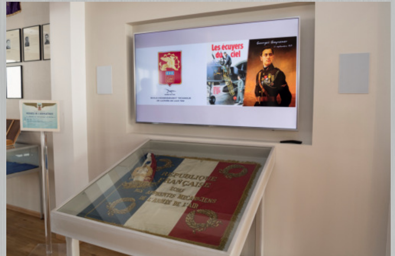
Salle tradition de l'école.

Si l'élève majeur n'est pas solvable, le remboursement des rémunérations est réclamé au représentant légal.