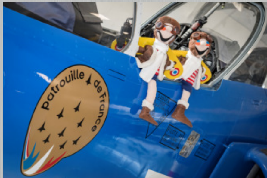
Les mascottes du BIA posées sur un alphajet de l'EETA aux couleurs de la patrouille de France.

Les élèves techniciens bénéficient de vacances scolaires. A titre d'exemple, vous avez ci-dessous le calendrier 2019-2020 des élèves de 1ère année. Un calendrier prévisionnel des vacances scolaires est remis aux familles le jour de l'incorporation. Ce calendrier est, à tout moment, susceptible d'être modifié à la diligence du commandement. Il n'est pas identique à celui de l'éducation nationale.