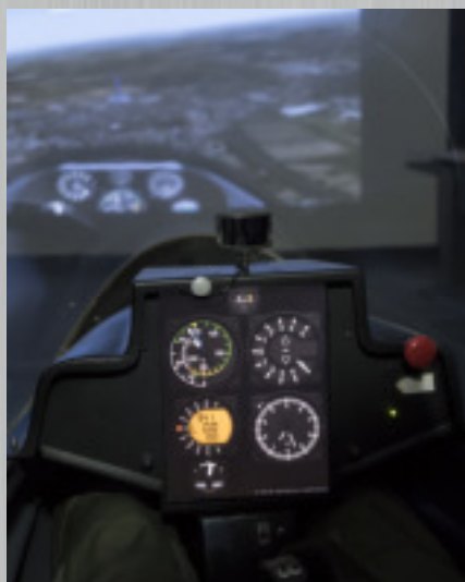
Simulateur du planeur.

Cette NAVVM est établie à partir de critères regroupés en trois rubriques : comportement général (militaire et scolaire), qualités personnelles et comportement relationnel. Une note inférieure à 10/20 peut entraîner l'exclusion de l'École.