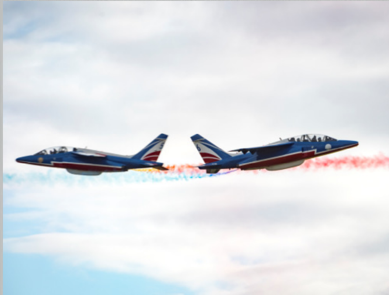
La patrouille de France au-dessus de l'école.

Tout manquement à l'honneur ou la discipline est sévèrement sanctionné et peut entraîner l'exclusion de l'école. Des résultats scolaires ou militaires insuffisants peuvent également amener à une proposition d'exclusion de l'école.