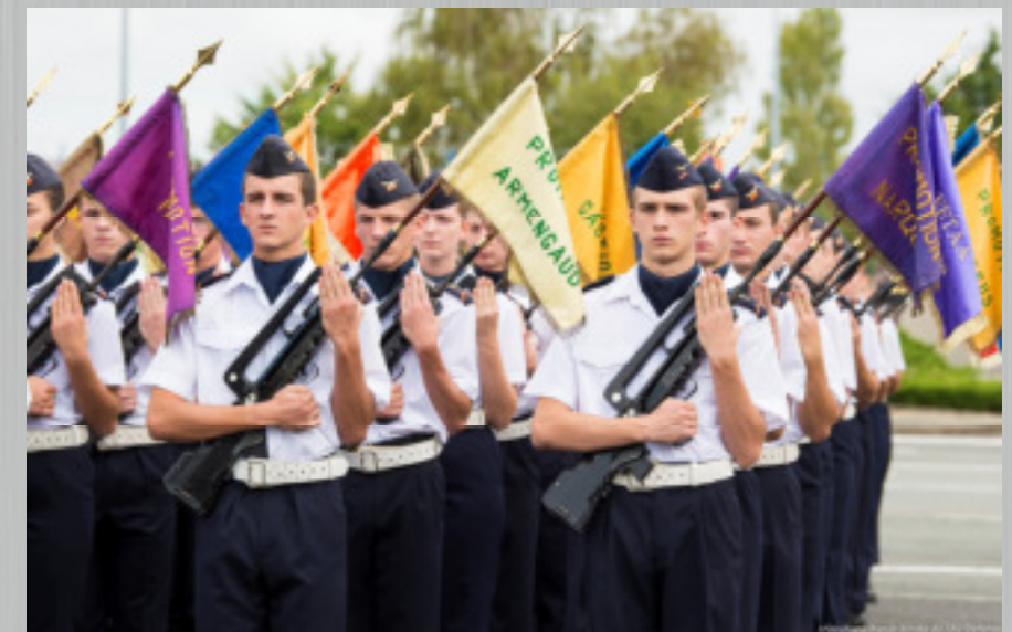
151 fanions pour 151 promotions passées à l'EETA en 70 ans !

La facturation du montant de la remise en état pourra être assortie d'une sanction disciplinaire.