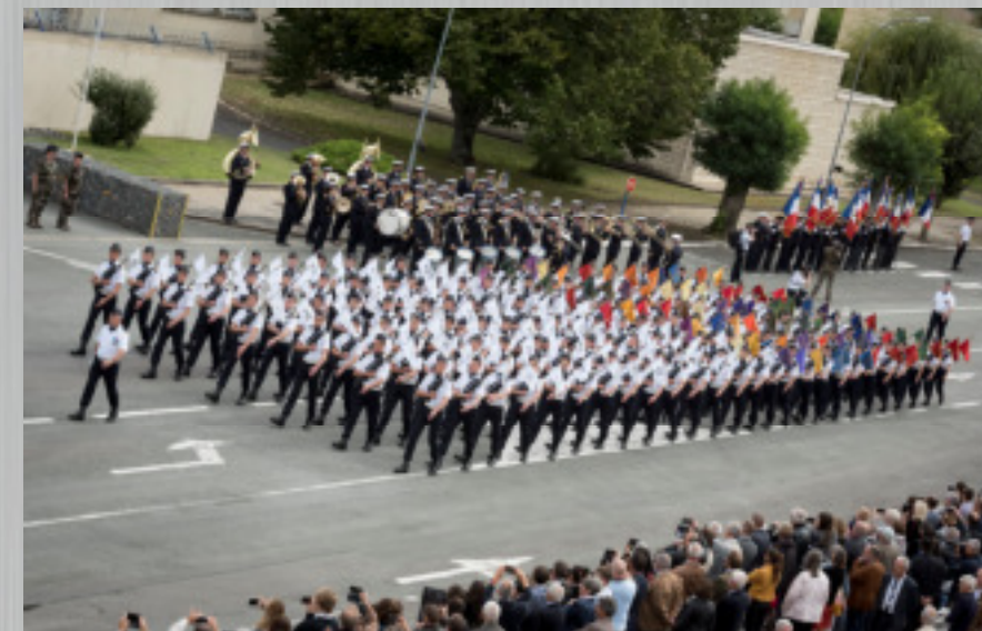
Défilé militaire durant la célébration du 70ème anniversaire de l'école.

Chaque année, la scolarité est ponctuée de cérémonies militaires auxquelles vous êtes cordialement invités :