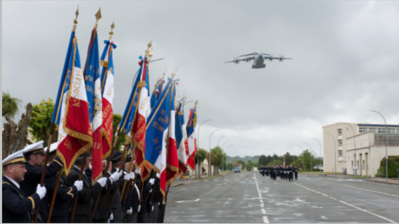
Passage de l'A400M lors d'une cérémonie militaire sur l'EETA 722.