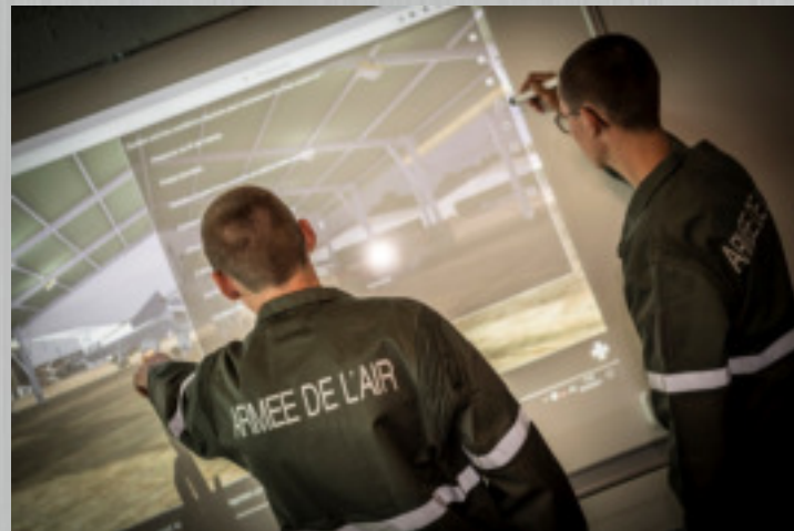
Les salles sont équipées de vidéoprojecteurs interactifs.