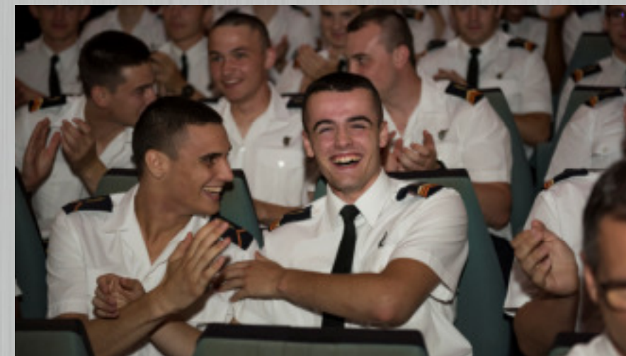
Les résultats des examens font chaque année la joie de nos élèves.

Conformément à la loi, les résultats scolaires de l'élève sont régulièrement transmis aux représentants légaux. Pour les parents divorcés ou séparés, le jour de l'incorporation, la copie de la dernière décision judiciaire, ou tout au moins la partie de la décision dans laquelle le juge se prononce sur les modalités de l'autorité parentale, doit être remise, ainsi qu'un document précisant clairement l'adresse à jour du deuxième parent. Si la procédure est en cours, une copie de l'ordonnance de non-conciliation doit être produite.