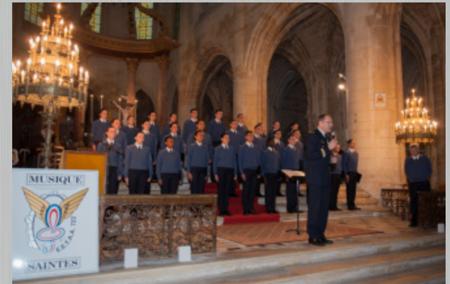
Concert de la chorale de l'école dans la cathédrale de Saintes

Sur sa demande, l'élève appartenant à toute confession est mis en rapport avec le ministre agréé de son culte par l'intermédiaire de l'aumônerie de la base de défense de Rochefort. Des visites des différents aumôniers ont lieu régulièrement sur l'École. Les préparations sacramentelles (baptêmes et confirmation pour les élèves, mariages) et les différentes animations (pèlerinage militaire international à Lourdes, marche de Noël, appel décisif à Bordeaux) peuvent être planifiées et organisées au profit de tous ceux qui le désirent.